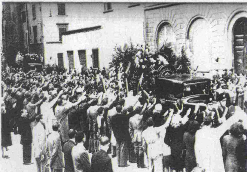
18 aprile 1944: la popolazione di Firenze rende omaggio alla salma di Giovanni Gentile durante i funerali solenni. Il filosofo fu sepolto nella basilica di Santa Croce

un occhio per qualche particolare azione del CLN in previsione di un futuro che li avrebbe potuti travolgere. Prima ho ricordato Ingrassia e Leto: il primo divenne questore e il secondo direttore delle scuole di polizia della Repubblica Italiana. Per il noto effetto "amnistia Togliatti".